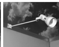
LEDアームスポットライト