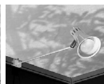
アームスポットライト